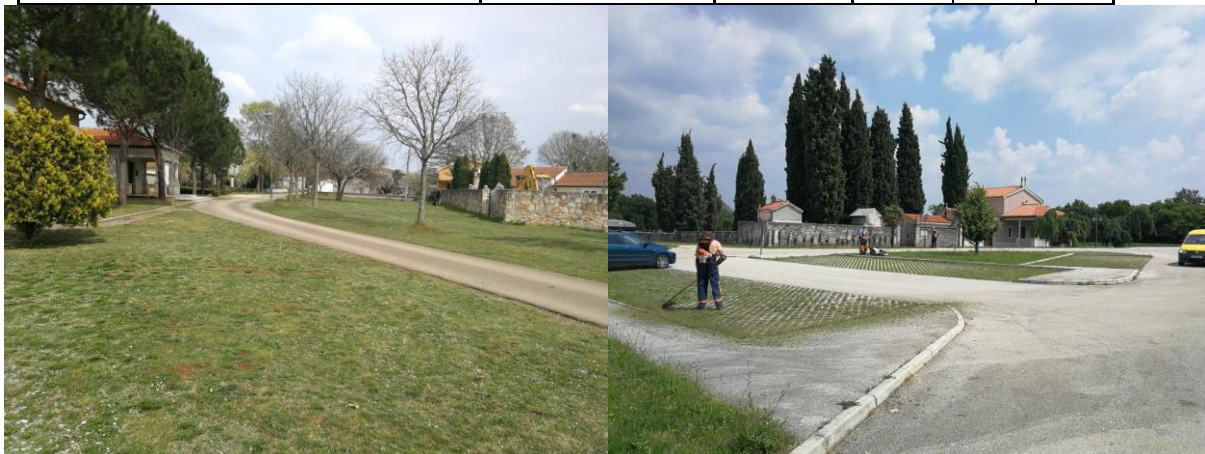
Tabela 4. Površine koje se kose leđnom motornom kosilicom (trimerom) u naseljima (ulice i prolazi)