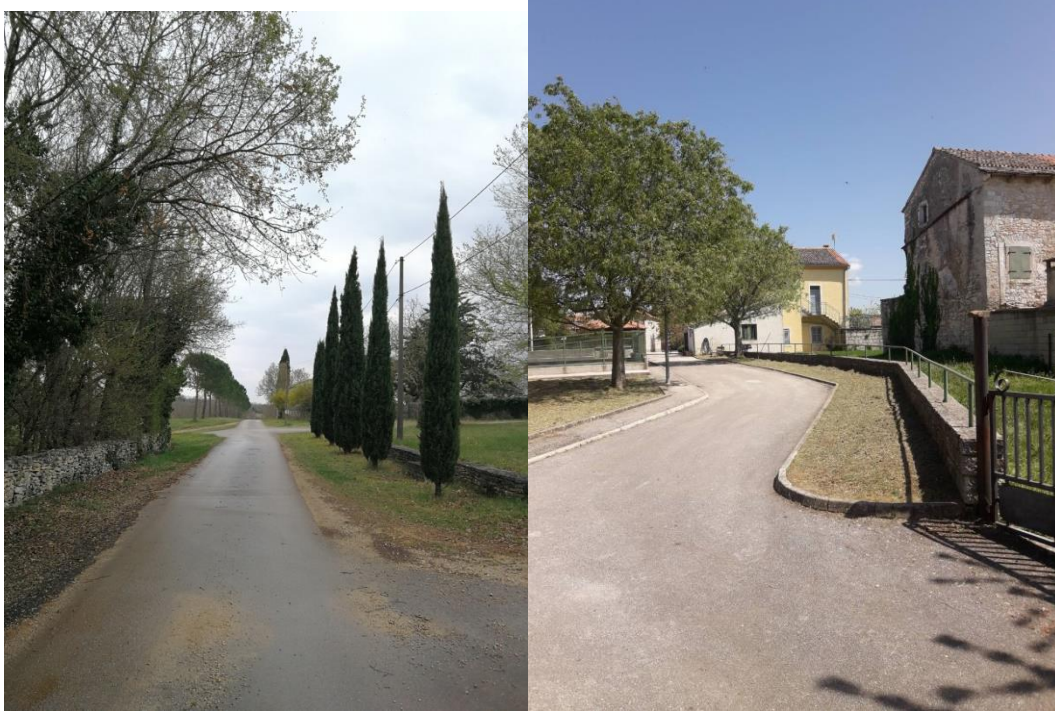
Tabela 3. Površine za košnju i održavanje na oko mjesnih groblji: