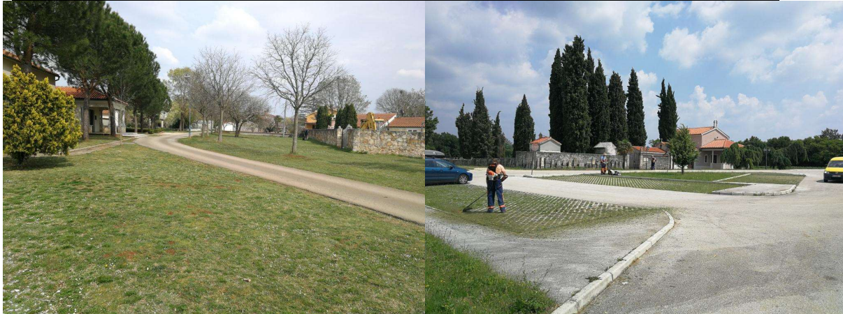
Tabela 4. Površine koje se kose leđnom motornom kosilicom (trimerom) u naseljima (ulice i prolazi)