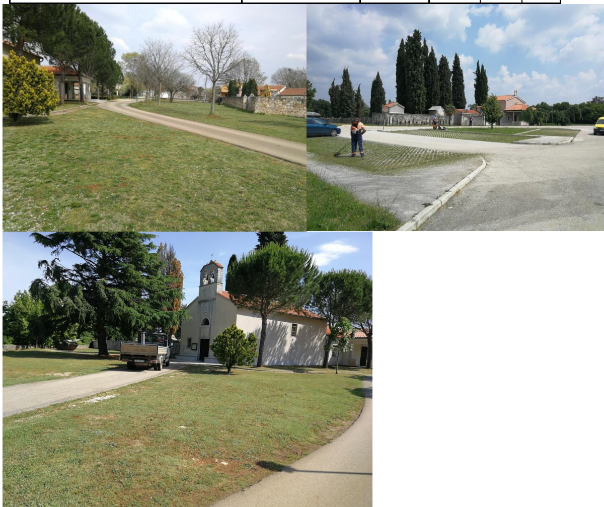
Tabela 4. Površine koje se kose leđnom motornom kosilicom (trimerom) u naseljima (ulice i prolazi)